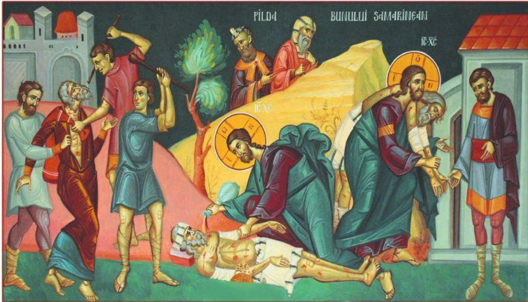
Pilda samarineanului milostiv (Luca 10, 25-37)

„În anul 2012 – Anul omagial al Sfântului Maslu și al îngrijirii bolnavilor – să ne rugăm și să lucrăm mai mult pentru alinarea suferinței celor bolnavi, să-i ajutăm cu bani, alimente și haine, cu vizite la spital sau la casa în care se află, spre a deveni mâinile iubirii lui Hristos pentru ei”.